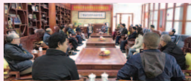
▲ 與東莞市潮汕商會舉行座談。