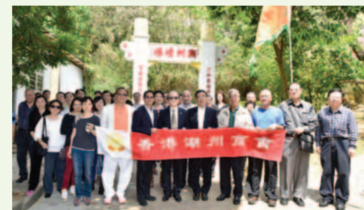
▲ 在沙嶺墳場前合照。