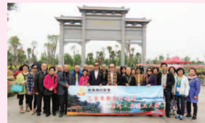
▲ 華陽湖濕地公園合照。

訪問團還暢遊惠州西湖，一睹優美城市風光；遊覽位於西湖岸邊的豐渚園，品味古色古香的勝景；前往極具歐陸特色的荷蘭花卉小鎮和奧地利風情小鎮哈斯塔特，體驗休閒生活；還在有八百多年歷史的黎氏大宗祠觀摩歷史建築，參觀香市影視城，體驗全球首創「穿越文化」影視基地。