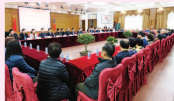
▲ 與惠州市潮汕商會舉行新春座談。