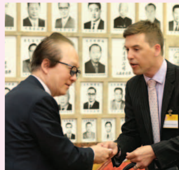
▲ 張成雄會長迎接澳大利亞駐香港總領事館商務署貿易專員Taliessin-Reaburn。