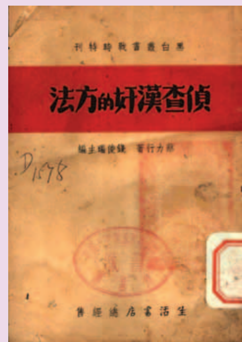
▲ 《偵查漢奸的方法》封面。

蔡力行（1917年—1999年），名俠蘭、敬昭，澄海西門人，世出鄉宦之家，就讀澄海縣立中學。1932年進入汕頭《嶺東民國日報》，是當時汕頭新聞界最年輕的記者。1935年至1937年間，蔡力行在南京和上海先後創辦《京報午刊》、《一報》、《新聞雜誌》月刊和《大地》旬刊，常常約請著名教授徐中玉、張文麟、王造時等人撰稿，主要專載國際時評、時事分析、各地通訊、詩歌文學等欄目，在文化事業繁榮的京滬兩地異軍突起。當時《大地》旬刊創辦人的蔡力行年僅二十歲。