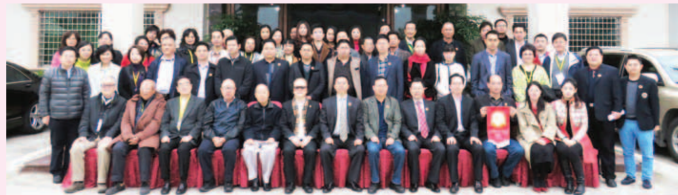
▲ 與惠州市愛國擁軍促進會首長合照。