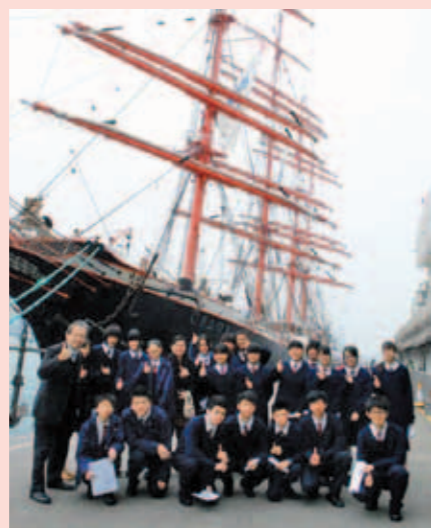
▲ 參觀古帆船「謝多夫」號。