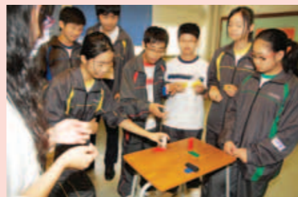
▲ 同學們進行小組活動。