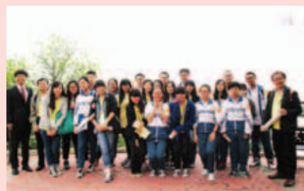
▲ 本校學生與汕頭市金山中學同學們進行交流。

與兩校學生交流。此外，同學們遊覽韓文公祠、湘子橋等名勝古蹟和饒宗頤紀念館，並透過市內定向比賽，認識潮汕文化。是次潮汕之旅為同學們提供了寶貴經驗，讓他們獲益良多。