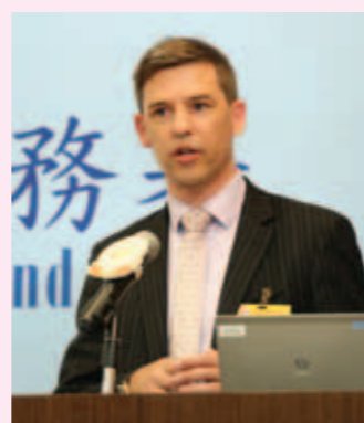
▲ 澳大利亞駐香港總領事館商務署貿易專員Taliessin-Reaburn發表演說。