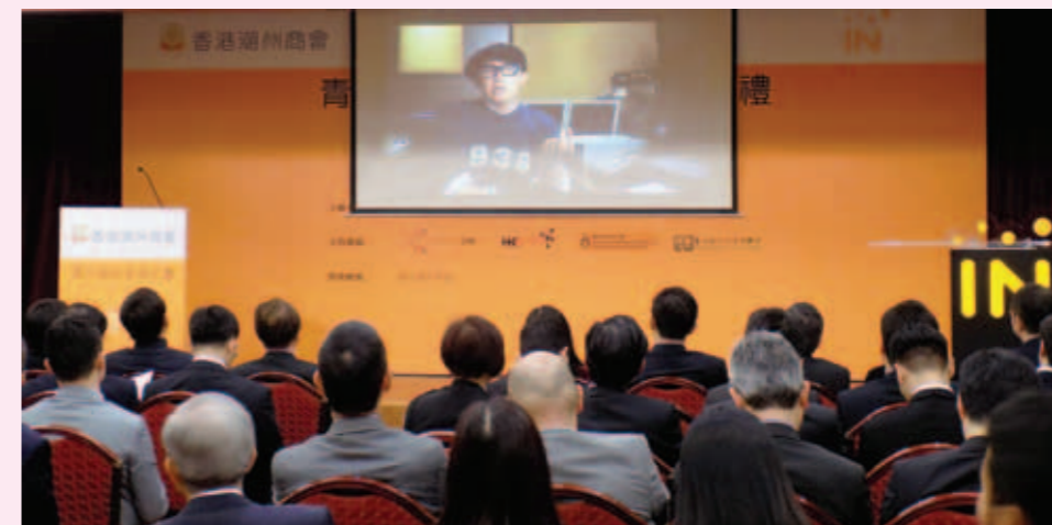
▲ 啟動禮播放了香港粵語流行歌曲知名創作人、文化大使雷頌德的錄像賀片。