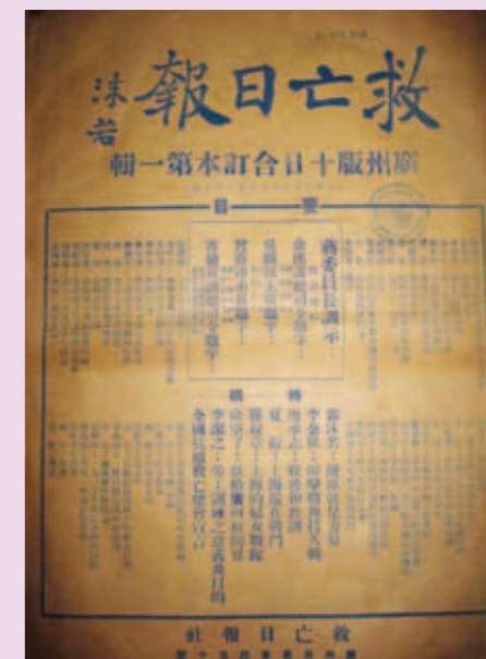
▲ 《救亡日報》第一輯封面。