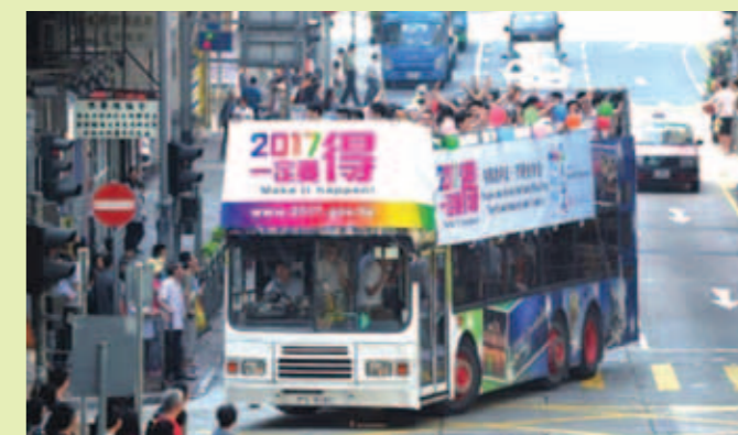
▲ 官員落區宣傳政改方案。