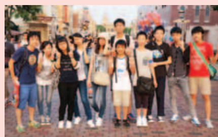
▲ 迪士尼樂園一天遊。

學們每年均有多次機會參加為新來港學童而設的校外活動。此外，駐校社工為新來港同學的家長提供各類支援服務，而本校辦學團體「潮州會館」更為有需要的同學們提供教育津貼，照顧非常全面。