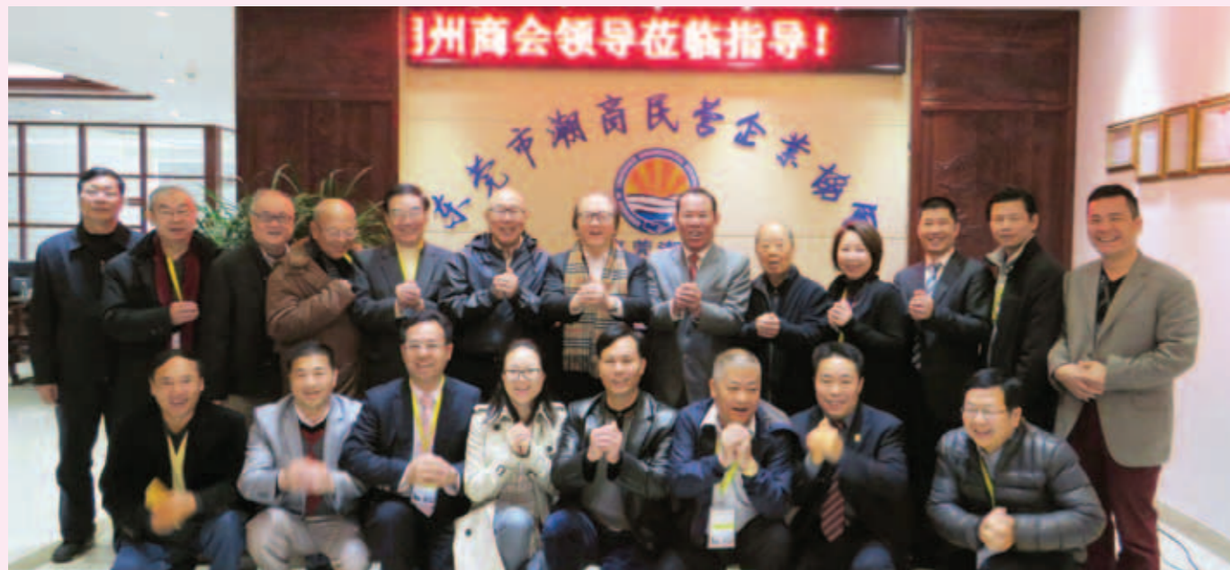
▲ 本會首長與東莞市潮汕商會首長合照。