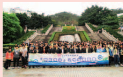
▲ 本校與友校師生代表合照。