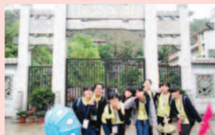
▲ 學生們參觀韓文公祠，心情興奮。